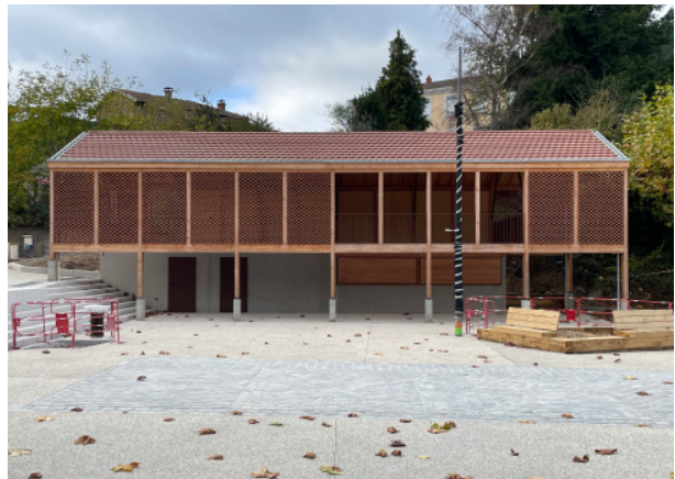
Vue de la place des Platanes et de la halle