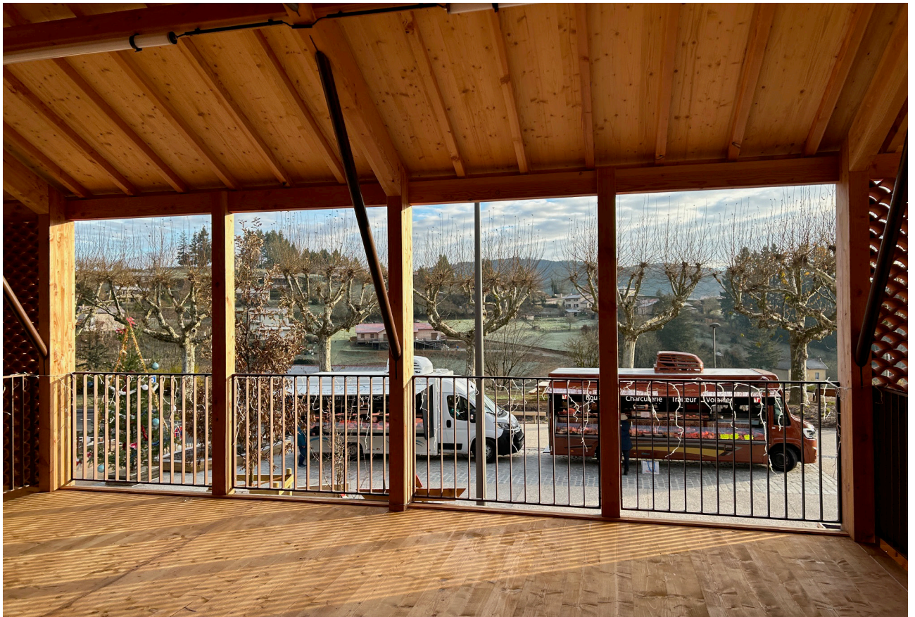
Vue sur le grand paysage depuis la mezzanine de la halle