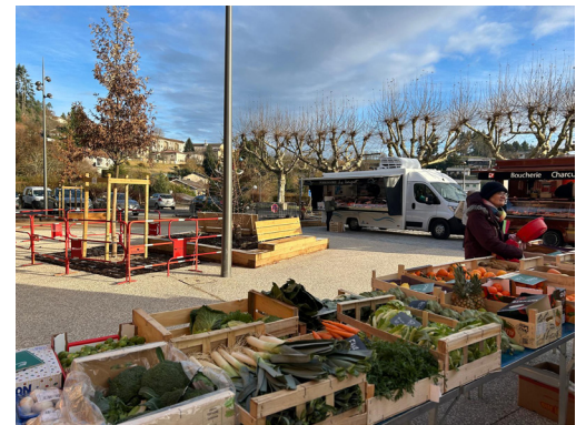
Vue de la place un jour de marché