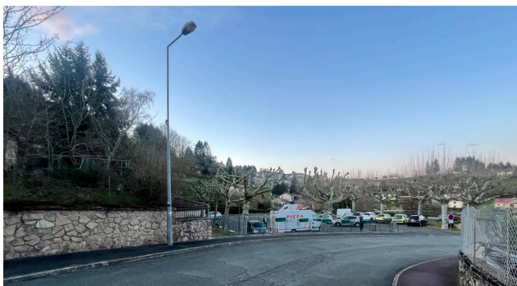
Vue de la place des Platanes depuis la rue Centrale - avant travaux