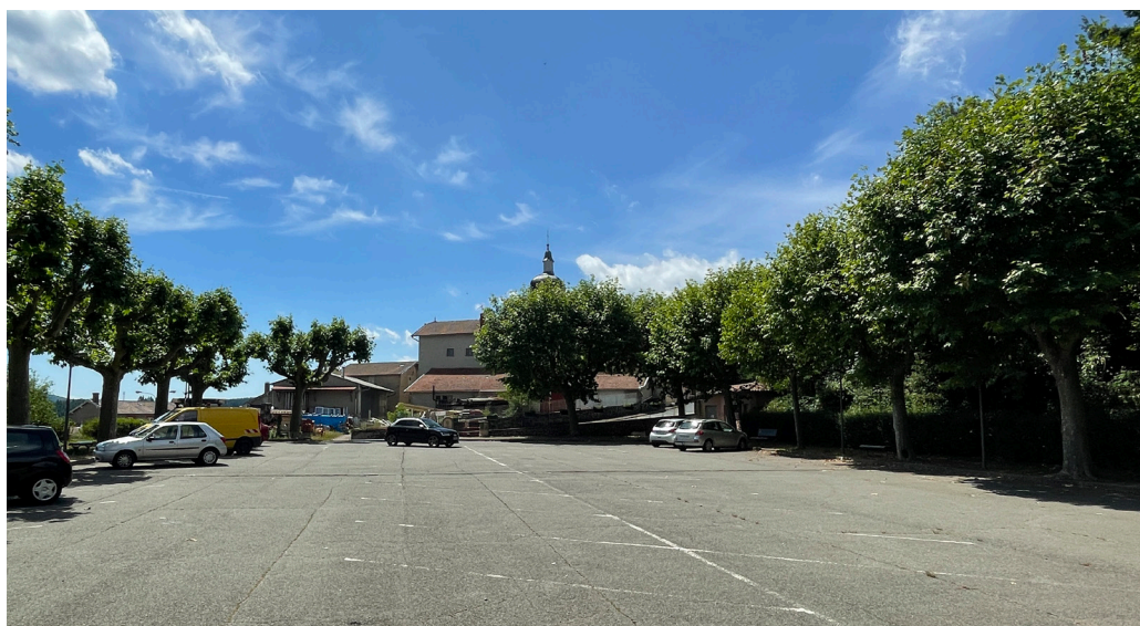
Vue de la place des Platanes - avant travaux