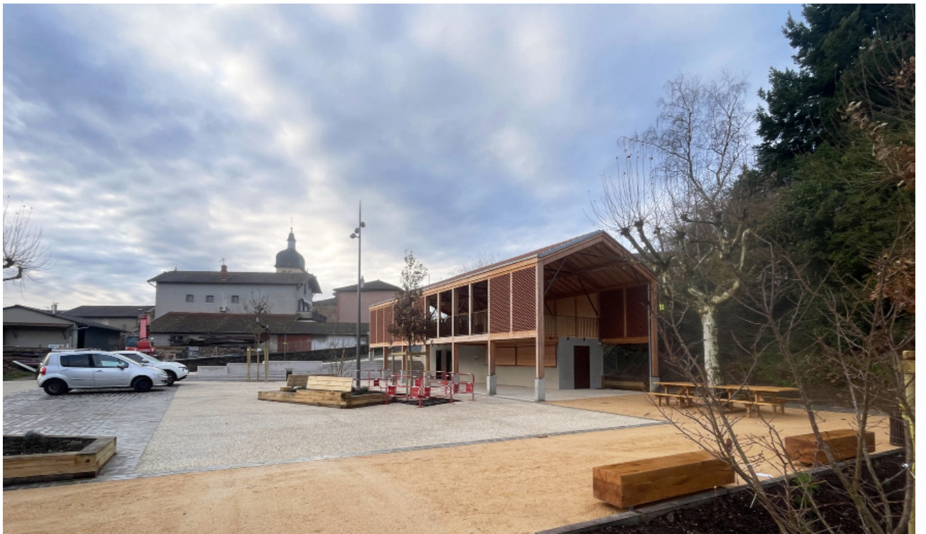
Vue de la place des Platanes et de la halle - A la livraison