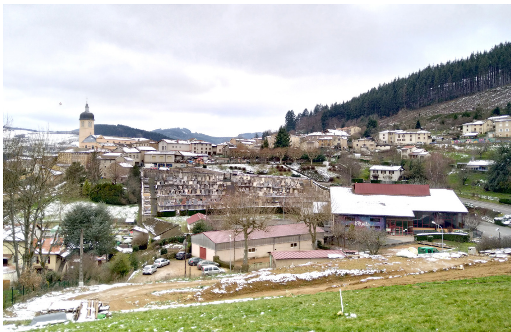
Vue de Grandris, village typique de la vallée d'Azergues