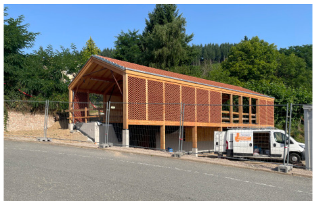
Vue de la halle depuis la rue Centrale pendant le chantier

NB: un reportage photographique sera réalisé au printemps avec les plantations