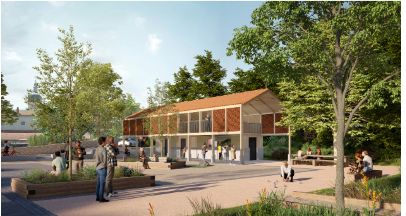
Vue de la place des Platanes et de la halle - Perspective PC