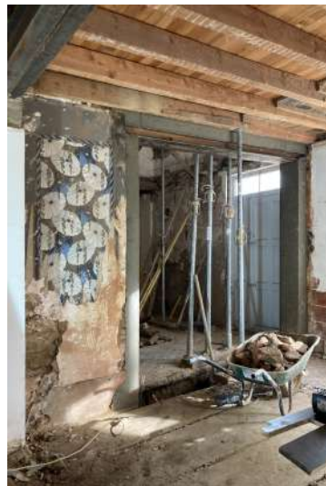
(4) CREATION D'UNE OUVERTURE DANS MUR DE REFEND - CREATION D'UN LIEN ENTRE LA FUTURE ZONE CUISINE ET LA PIECE DE VIE