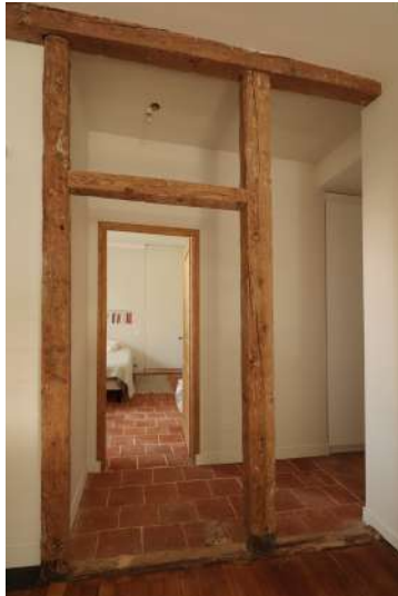
(16) R+1, RESTAURATION DE LA TOMETTE ET DES PANS DE BOIS RESTRUCTURATION DES ESPACES ET DES CIRCULATIONS