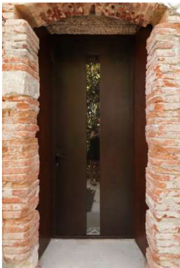
(1) ADAPTATION DE LA PORTE D'ENTREE ISSUE DU RE-EMPLOI EN COURS DE CHANTIER