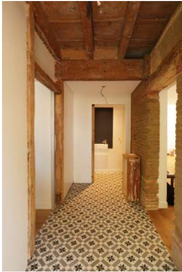
(18) ENTREE, DEPOSE DES REVÊTEMENTS SUPERFLUX MISE A NU DE LA STRUCTURE RESTAURATION DU MUR EN TERRE CRUE