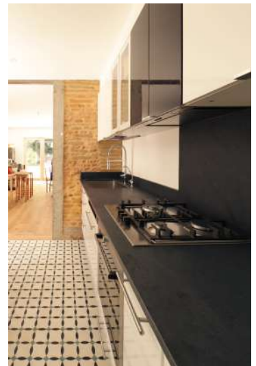
(4) CREATION D'UNE OUVERTURE DANS MUR DE REFEND - CREATION D'UN LIEN ENTRE LA FUTURE ZONE CUISINE ET LA PIECE DE VIE