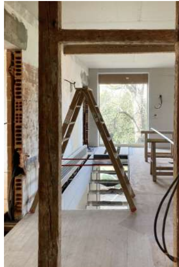
(16) R+1, PHASE CHANTIER CREATION D'UNE OUVERTURE EN FACADE POUR CONNECTER LA MAISON AU JARDIN CREATION D'UNE TREMIE ADAPTEE A L'ESCALIER DE RE-EMPLOI