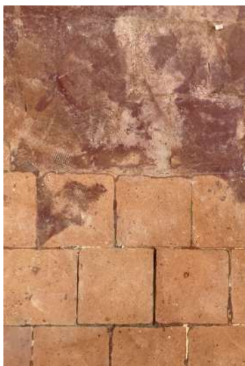
(13) R+1, RESTAURATION DE LA TOMETTE