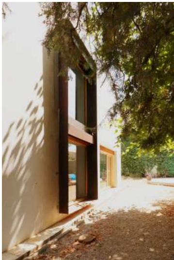
(10) FAILLE VERTICALE CADRE ACIER CORTEN, BSO & MENUISERIE BOIS