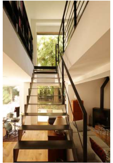
(8) R+1, PHASE PROJET ESCALIER DE RE-EMPLOI FAILLE TOUTE HAUTEUR