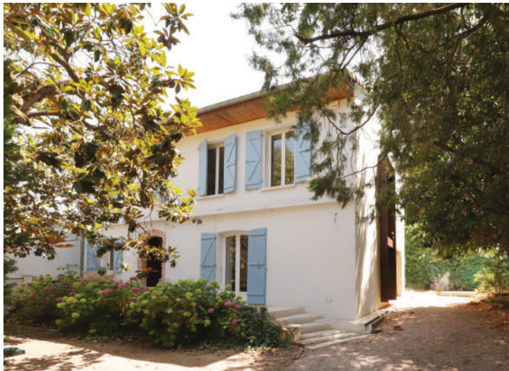
(1 & 10) BÂTISSE EXISTANTE ET FAILLE VERTICALE SUR FACADE OUEST