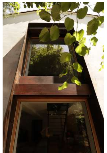
(10) FAILLE VERTICALE CADRE ACIER CORTEN, BSO & MENUISERIE BOIS