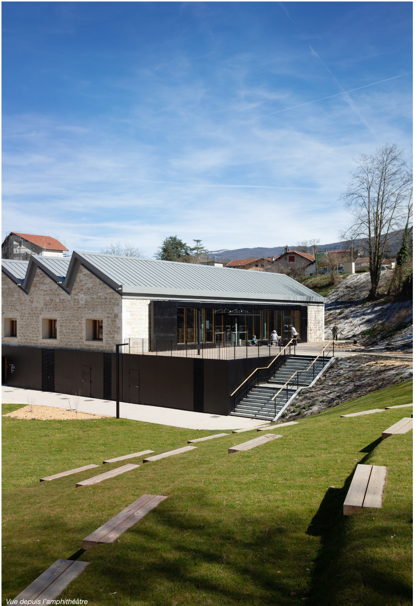
Vue depuis l'amphithéâtre