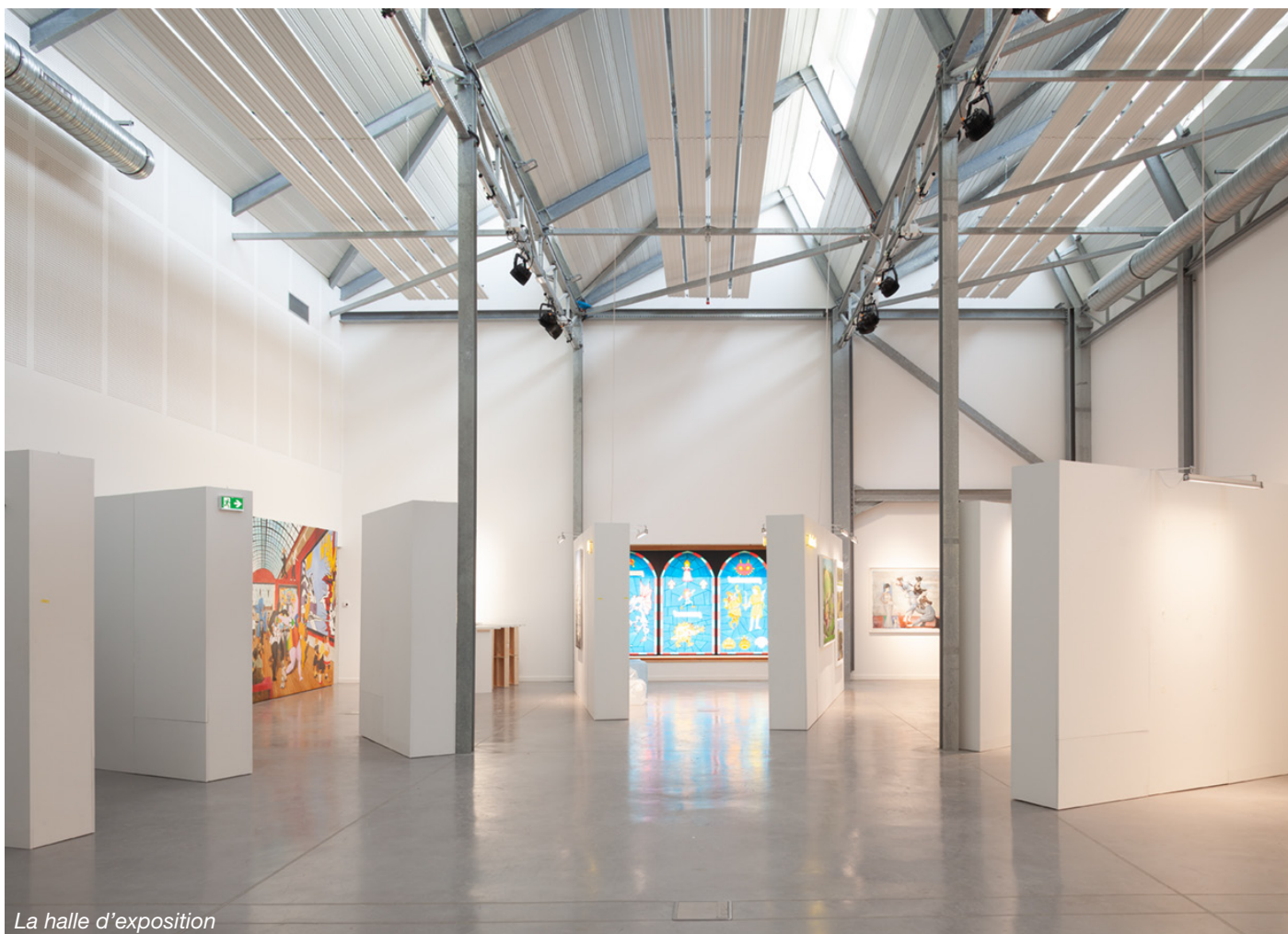
La halle d'exposition