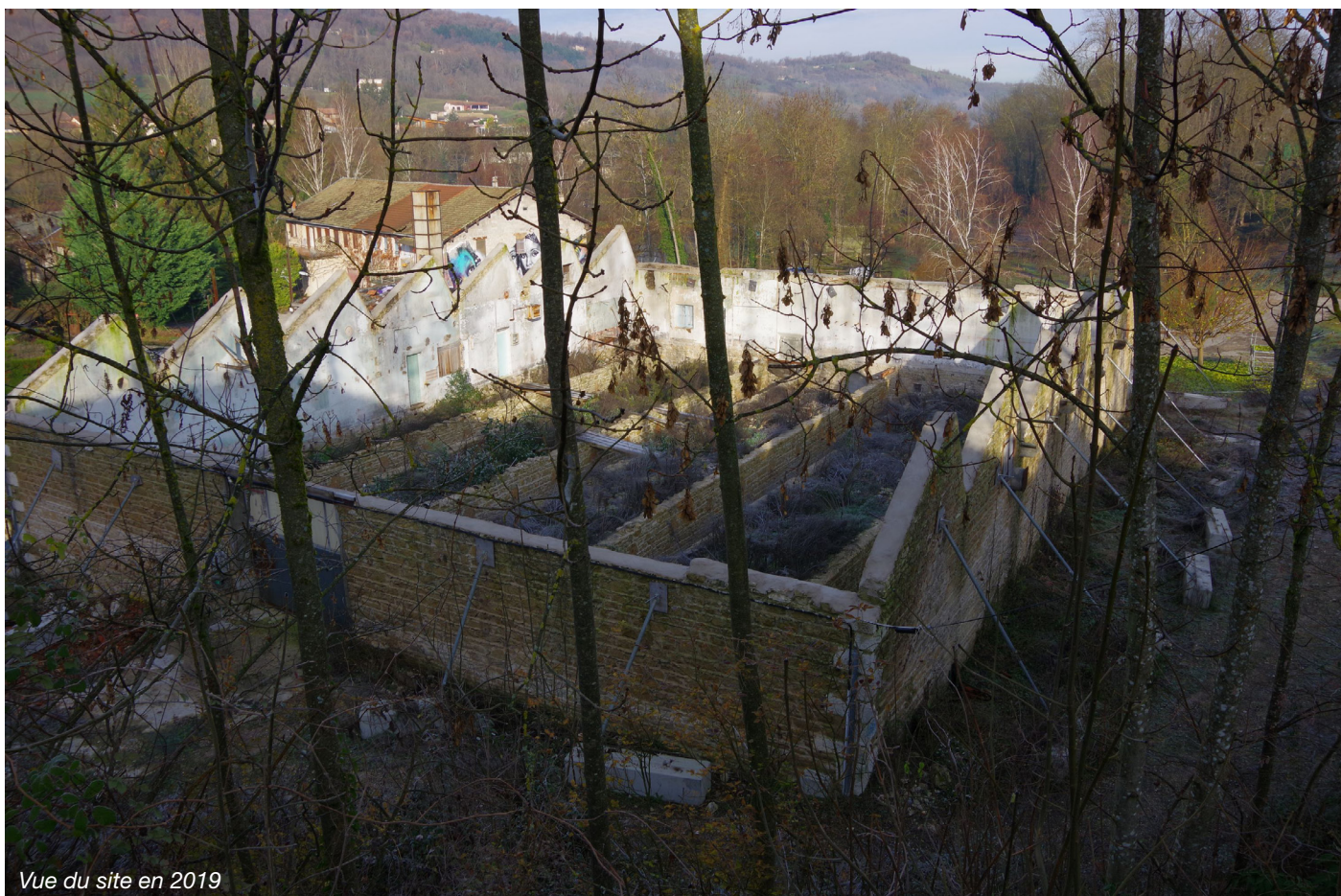
Vue du site en 2019