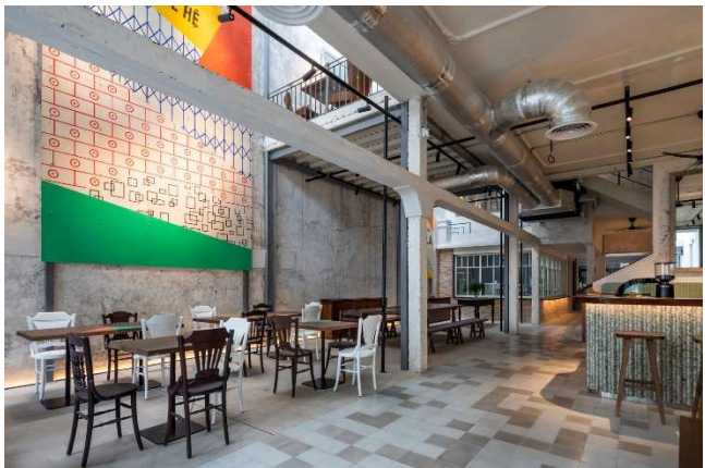
Espace du Café avec ligne de production de boutons de cacao sur l'arrière