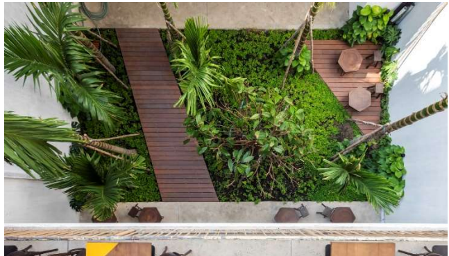
Jardin créé à l'occasion du projet : dés-imperméabilisation du sol, fraîcheur, lumière et ventilation naturelle