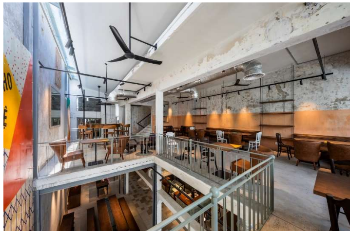
Structure en béton conservée et création de « patios intérieurs » pour connecter le RDC et l'étage entre eux

des bâtiments existants (toujours mieux que démolir et reconstruire). Ensuite, nous avons réduit au maximum le nombre de nouveaux matériaux. Tous sont sourcés et produits au Vietnam, pour éviter les coûts de transport inutiles et la pollution liée. Enfin, KANOPEA a privilégié autant que possible les matériaux naturels ou bas carbone pour assurer une bonne qualité de l'air (zéro chimie) : carreaux de ciment locaux non cuits, bois massif pour