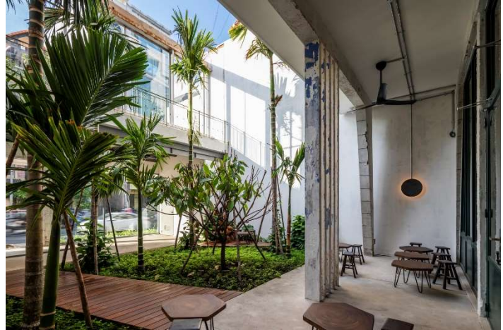
Jardin / Patio créant une zone tampon entre la rue et le café. La façade sur rue fait office de mur anti-bruit

isolé du bruit de la rue. Le jardin tropical s'inspire des plantations des agriculteurs de Ben Tre dans le Delta du Mekong produisant les fameuses cabosses de cacao. Nous avons spécifié des palmiers typiques du Delta du Mékong ainsi qu'un très beau et productif cacaoyer, comme symbole. Quelques végétaux supplémentaires couvriront bientôt les murs et apporteront de la fraîcheur, sans nécessiter d'entretien important ; KANOPEA cherchant toujours à réduire la consommation