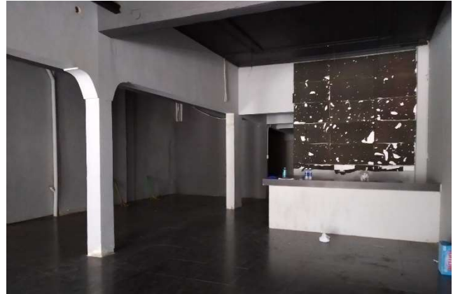
Batiment avant réhabilitation

Lors de la première visite de l'équipe KANOPEA, nous avons vu un bel escalier en terrazzo, ainsi que des corniches au plafond, tous deux typiques de la période moderniste. C'est pourquoi nous avons recommandé de sélectionner cet emplacement au client pour créer son premier lieu The Cocoa Project, car le patrimoine architectural était en adéquation avec l'authenticité que nous recherchions tous. Nous avons procédé étape par étape, enlevant couche après couche, découvrant d'anciens garde-corps, des persiennes verticales en béton, d'anciennes peintures à la chaux. Et