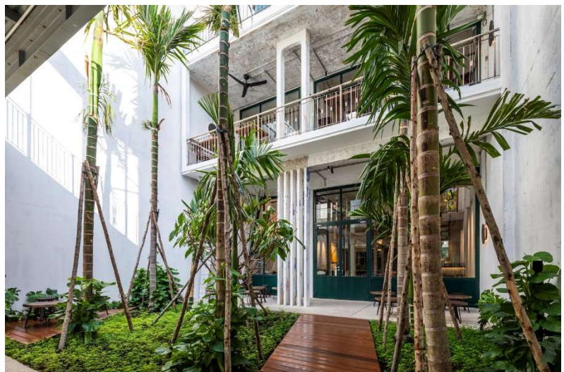
Façade sur patio apres réhabilitation

L'intention principale de l'équipe KANOPEA était de remettre en valeur une belle Villa moderniste tropicale existante des années 50 et de lui donner une seconde vie dédiée au cacao et à la pâtisserie. Un lieu pour les Vietnamiens, pour renouer avec leur patrimoine et leur faire prendre conscience de la qualité de leur cacao produit dans le delta du Mékong.